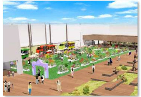
※ガーデンコンテスト開催イメージ

※12月中に応募がスタートする予定です。詳細は決定次第、 ミナモア公式 WEB サイトや SNS 等でお知らせします。