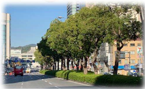
駅前通りのクスノキ