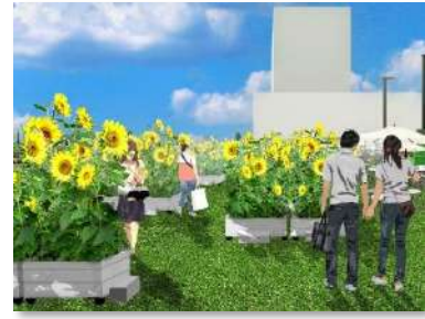
※デザインガーデン展開イメージ