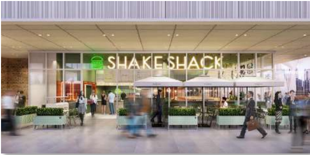
2階東側 シェイクシャック